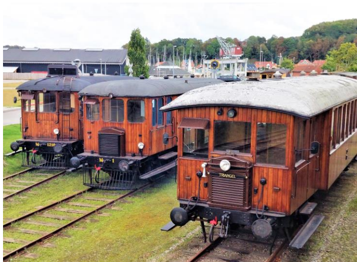
1926 hos Vognfabrikken Scandia A/S i Randers. En tip-top restaureret motorvogn.

Søndag den 22. juni er der lagt op til en hyggelig familiedag hos veteranbanen.