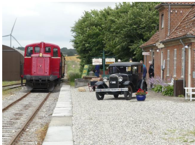
Frichs diesellokomotiv fra 1953 på 375 hk.

Søndag den 22. juni er en ordinær køredag hos veteranbanen. Denne dag fremføres togene af vores fireakslede lokomotiv.