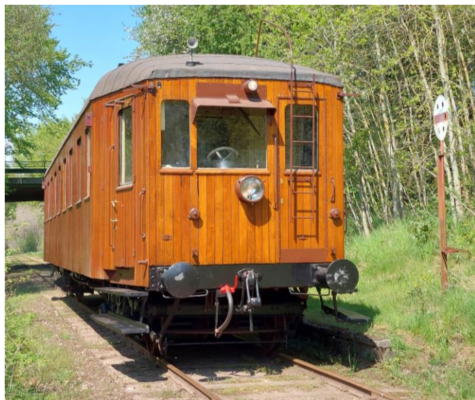
Hadsund-Peter, Danmarks næstældste motorvogn

Der vil også være mulighed at se Danmarks næstældste motorvogn, en Kielervogn , bygget i