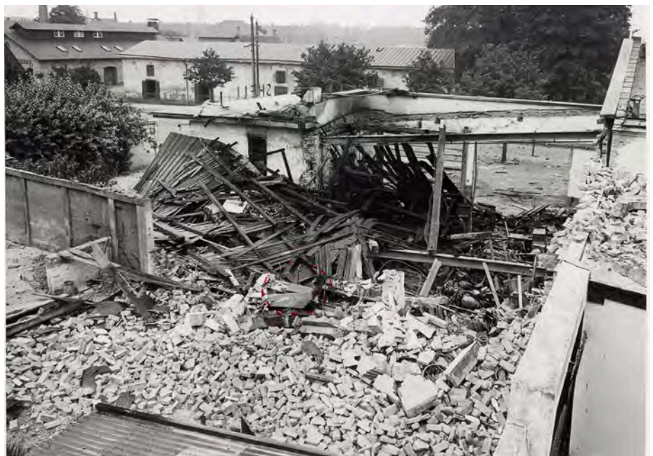
Set fra bagsiden af bygningen er det tydeligt, at motorcykelværkstedet er fuldstændig ødelagt. Her og der kan der skimtes nogle af Værnemagts motorcykeldele.