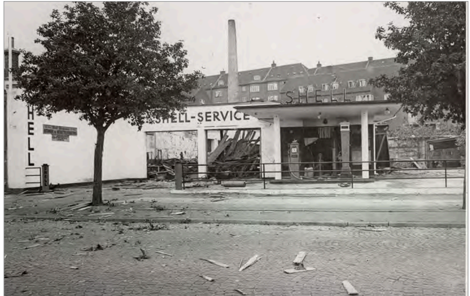
Rejsegruppens første sabotage den 21. august 1944 mod Brdr. Jørgensens Motorcykelværksted på Silkeborgvej 20.

Størsteparten af de århusianske sporvogne blev ødelagt.