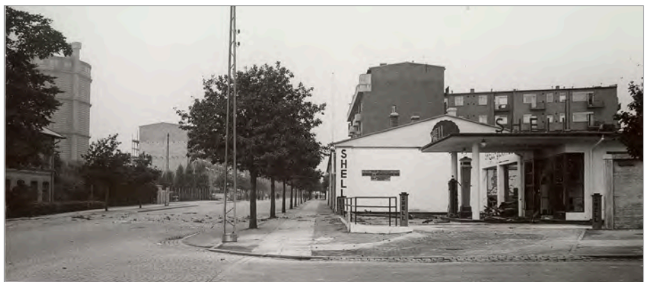
På næsten samme sted ligger der i 2012 stadig en tankstation. Billedet er taget set fra Herningvej med Silkeborgvej til venstre og yderst til venstre den tidligere gasbeholder ved Dollerupvej, hvor der i dag er en afdeling af Aarhus Købmandsskole, tidligere Teknisk Skole.