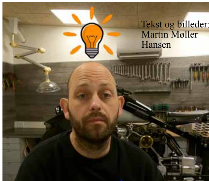
Tekst og billeder: Martin Møller Hansen

med tabletten (altså ikke dem man sluger) og/eller mobiltelefonen. Ind på Youtube - søgeord NIMBUS. Frem vælter 7 "hits". 3 af dem omhandler nimbus-motorbåde....., tilbage står 3 videoer. Fælles for disse 3 er at de er over 10 år gamle, optaget med mobil-telefon i en så dårlig opløsning, at man har svært ved at skelne mellem motorcykler og sidevogne, og den altid tilstedeværende baggrundsmusik ud ført med harmonika, som var det finalen til en "Lasse og Mathilde" look-alike-konkurrence.